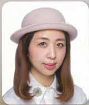
Catherine Senior Editor

MODERN BEAUTY SALON由曾裕博士於1991年創辦，時至今日已是享譽亞洲的美容王國，更成為本港首間上市的美容集團。多年來MODERN BEAUTY SALON積極開拓多種服務及產品品牌，致力為天下女性實現美麗承諾。作為香港首屈一指的美容上市集團，MODERN BEAUTY SALON不斷提高服務質素及美容團隊的專業服務水平，更會定期引入外國優質美容產品、高科技美容及纖體儀器，為顧客提供一站式美容修身體驗；在水療服務方面，MODERN BEAUTY SALON旗下裕SPA水療中心及貝倚六星級水療生活館更具有多種水療浸浴及按摩療程，讓大家可以大眾化價錢享受各種高質素美容纖體及水療服務，放鬆身心。